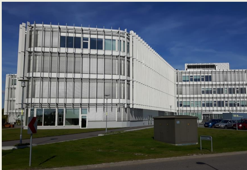
DHF's kontor i Høje Tåstrup og GSPDs stab på hovedkontoret i Accra.

Formålet er mindske fattigdom for 400 jordløse bønder – inklusiv 40-60 personer med fysiske handicap (PWDs).